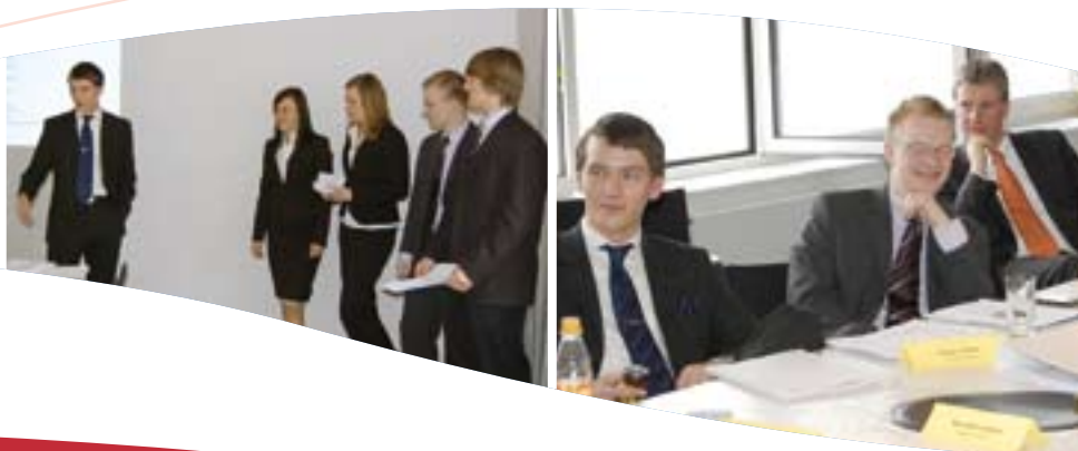
Wirtschaft in der Praxis: In den WIWAG-Planspielen des UV Kiel...

schaften. Dabei agieren die fiktiven Unternehmen auf einem fiktiven Markt jeweils gegeneinander. Vormittags erhalten die Schüler theoretischen Unterricht von ehrenamtlich tätigen Mitarbeitern aus verschiedenen Unternehmen (Tutoren). Das jeweils Erlernete ist am Nachmittag Basis für ebenfalls fiktive Entscheidungen des jeweiligen WIWAG-Unternehmens. Am Ende der einwöchigen Veranstaltungen stellen sich die Jungunternehmerinnen und Jungunternehmer dann