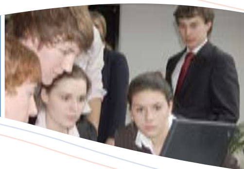
Der Nachwuchs im Fokus: Der UV Kiel bietet Seminare für Auszubildende und Berufsanfänger

Die Leistungsfähigkeit des dualen Ausbildungssystems, praktiziert an den Ausbildungsorten Betrieb und Berufsschule, ist in Deutschland etabliert und allgemein anerkannt. Dennoch gibt es aus Sicht der Wirt-